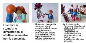
Illustrazioni delle piste di azione

2012): accoglienza, circolazione della parola, co-costruzione del sapere, forza del lavoro di gruppo, e più particolarmente “ reconnaître l'étudiant comme acteur de ses apprentissages et non plus comme un receveur passif de l'enseignement du formateur ; garantir un accueil confiant de la singularité de tout étudiant ; avoir une approche empathique des problématiques de chacun (...) ” (Favel et Lapujade, 2012, p. 82).